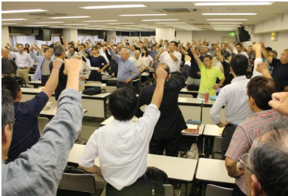
安倍政権の退陣に向けて全体で団結がんばろう

千葉労連は、第 29 回定期大会を 9 月 3 日に千葉県教育会館で開催しました。参加者は、代議員、常任幹事、来賓、オブザーバーを含め 152 人。大会では、安倍政権の暴走を許さず、憲法をいかした運動を進め、7 万千葉労連を建設する方針を、全会一致で採決しました。また 2017 年度の新役員が選出されました。