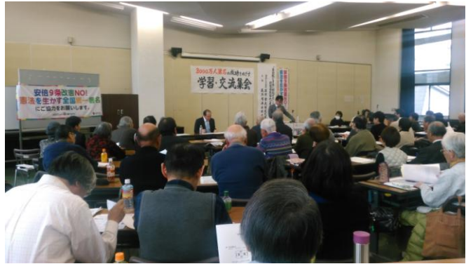
改憲発議を阻止するために様々な団体が参加して意思統一＝松戸地域

署名に協力していただいた人から「平和を守るためにも絶対に憲法を変えてはいけません。頑張ってください」という声が寄せられ、宣伝参加者からは「やってよかった。これからも大勢でこういう宣伝行動に取り組もう」という意気込みが語られました。