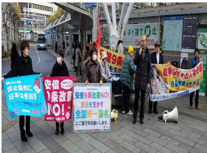
24 人の参加で 22 筆の署名が集まった

国会で憲法改正に向けての議論が進む中で、安倍首相が狙う 9 条改正の中身の危険性が明らかになってきています。安倍首相は「憲法に自衛隊を書き込むだけ」と言いますが、自衛隊を明記すれば 9 条の 1、2 項（戦争の放棄、戦力不保持）を残したとしても、後からつくった法律が前の法律に優先するという法の原則によって、2 項が空文化し、無制限の武力行使が可能になります。安倍改憲をストップさせるべく、県内各地で運動が広がっています。