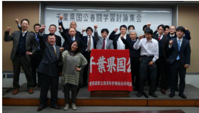
団結して奮闘することを確認

それぞれの組織からは、慢性的な人手不足が続く、職員は疲弊している現状が報告されました。こうした中で、人件費を削ることは、何の展望も希望も生み出さない。徹底的に賃上げを要求し、国や自治体に対して医療・介護、福祉経営者とともに、医療報酬の改定等を求めていくよう呼びかけることが労働組合の果たすべき役割であること。そして要求を前進させ、社会的力関係を大きく変え、格差と貧困を解消し地域経済の活性化、憲法や労働法制の改悪阻止のたたかいで春闘勝利を目指すことが確認されました。