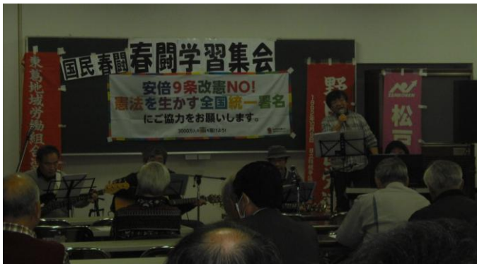
改憲の動きを学び改悪阻止に向け意思統一

2018年春闘も山場を迎えています。今年の春闘は国会で「働き方改革」が議論されている中で重要な取り組みです。昨年末に開催された千葉県国民春闘討論集会后、各組織で春闘要求を決める議論がされています。いくつかの組織の討論集会の様子を紹介します。