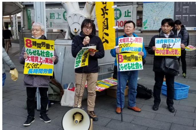
春闘要求を訴える参加者

15 時から JR 千葉駅、クリスタルドーム前、そごう前、フクロウ交番前にて、ビクトリーマップと春