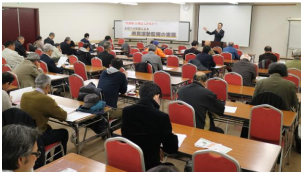
学びは力 みんなで共謀罪法廃止を