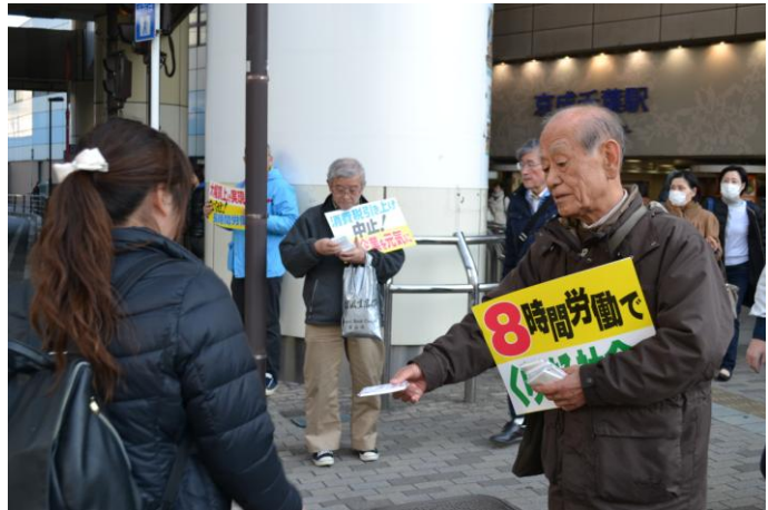
2000 個のチラシ入りティッシュを配布

千葉労連の春闘決起集会&宣伝行動に初参加した自治労連の青年は、「働き方改革の中身などは全然知らなかった。今回決起集会で中身を知ってぞっとした。おそらく法案の中身を知らない人はまだたくさんいる。少しずつでも宣伝行動をして、多くの人に知らせていくことが大事であると感じた」という感想を述べました。