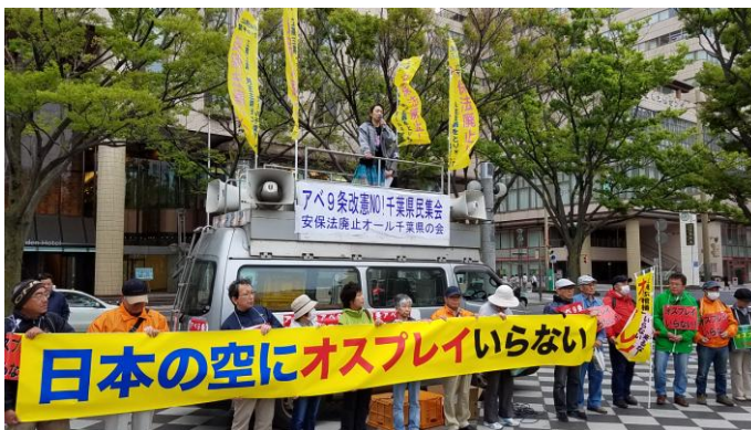
習志野基地問題やオスプレイ 暫定配備反対を訴えた

強風の吹き荒れる中、『アベ9条改憲NO!千葉県民集会』が4月7日、千葉市中央公園で安保法廃止!立憲主義・民主主義をとりもどすオール千葉県の会主催で開かれました。集会には、全県から千葉労連をはじめ、安保法廃止を求める弁護士会の会・千葉、再び戦争をさせない千葉県1000人委員会、憲法を守り・いかす千葉県共同センターなど、党派を超えた様々な団体から、1500人が結集しました。