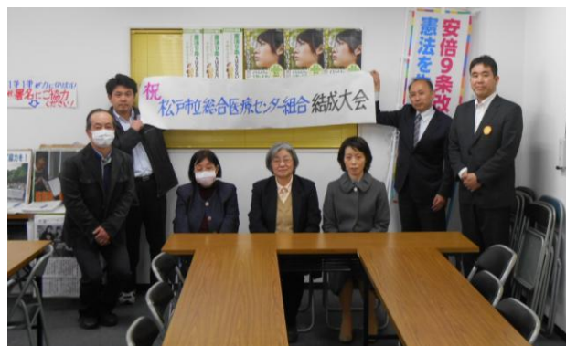
結成大会に参加した組合員と祝福に駆けつけた仲間

2016 年 1 月、医労連に旧松戸市立病院の看護師から「労基法違反、ハラスメントが当たり前の職場になっている。改善したい」と相談がありました。相談を受けた医労連は松戸労連にも支援を求め、早朝の職員向けビラまき宣伝を開始しました。法令違反やハラスメントの実態を明らかにするため、情報提供を目的に 16