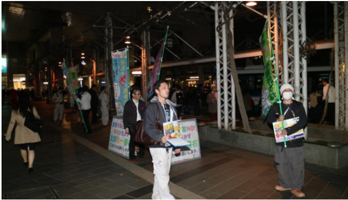
夜の千葉駅に職人の「署名お願いします」の声が響いた

また、千葉労連青年部からも 2 名の応援もあり、仕事や職場を越えた繋がりが青年の平和活動にも広がりつつあります。