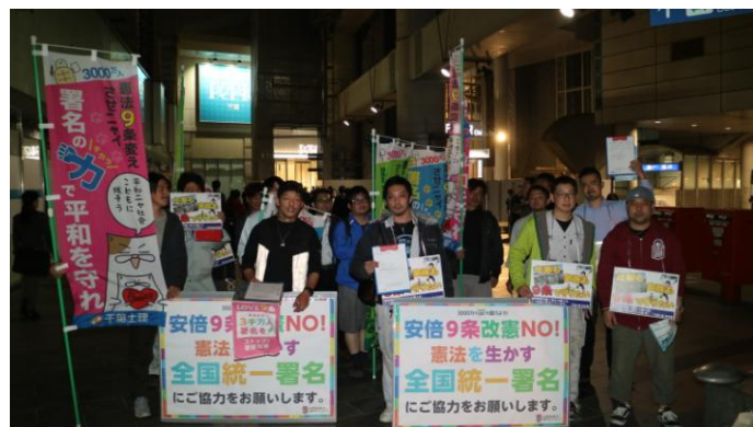
仕事と家族を守るため「俺たちも平和活動しよう」と9条宣伝を実施した千葉土建青年部

初めて画板を持った最年少19歳の大工は「一人も署名してくれなかったっす」と残念がっていましたが、短時間で30人以上に声をかけるなどガッツ溢れる行動力をみせました。