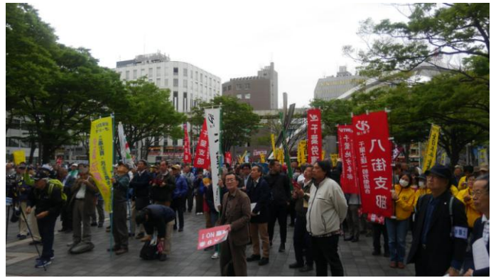
党派を超えた様々な団体が結集

集会参加者全員で、3000万署名をやりきり、アベ9条改憲を阻止しようと訴えた集会アピールを採択し、市内パレードを整然とおこないました。