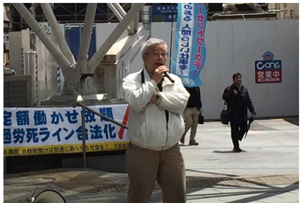
ディーセントワークを訴える